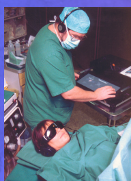
Salle de réveil

Tester en milieu clinique pendant plus de 20 ans