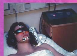
Laboratoire du sommeil